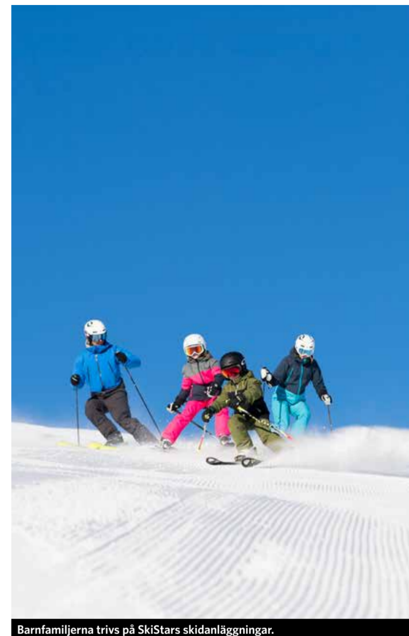
Barnfamiljerna trivs på SkiStars skidanläggningar.

” De nordiska besökarna ökar, men även européer som briter och tyskar.